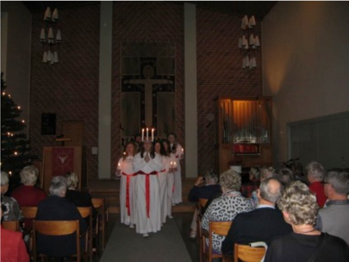
Trelleborgs Lucia med tärnor