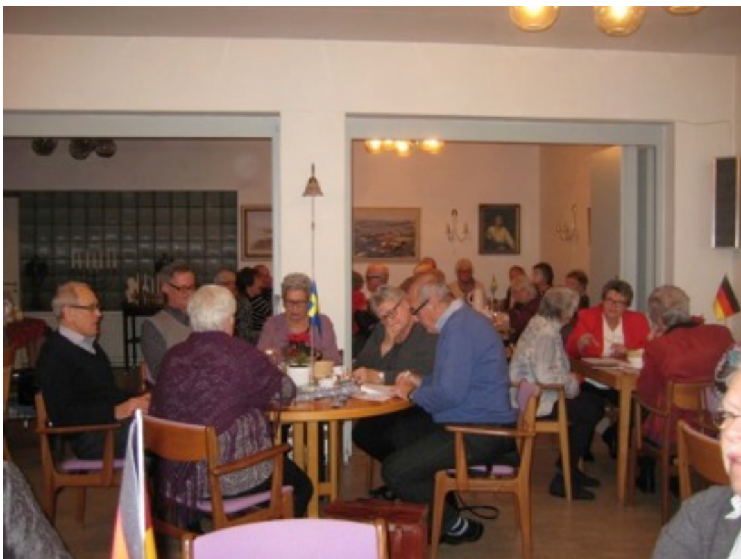
Pratglada medlemmar njuter av förtäringen

Tyska och svenska julsånger förgyllde denna stämningsfulla kväll, som avslutades med kaffe och Birgits hembakade kakor, innan vi skildes åt i den mörka decemberkvällen.