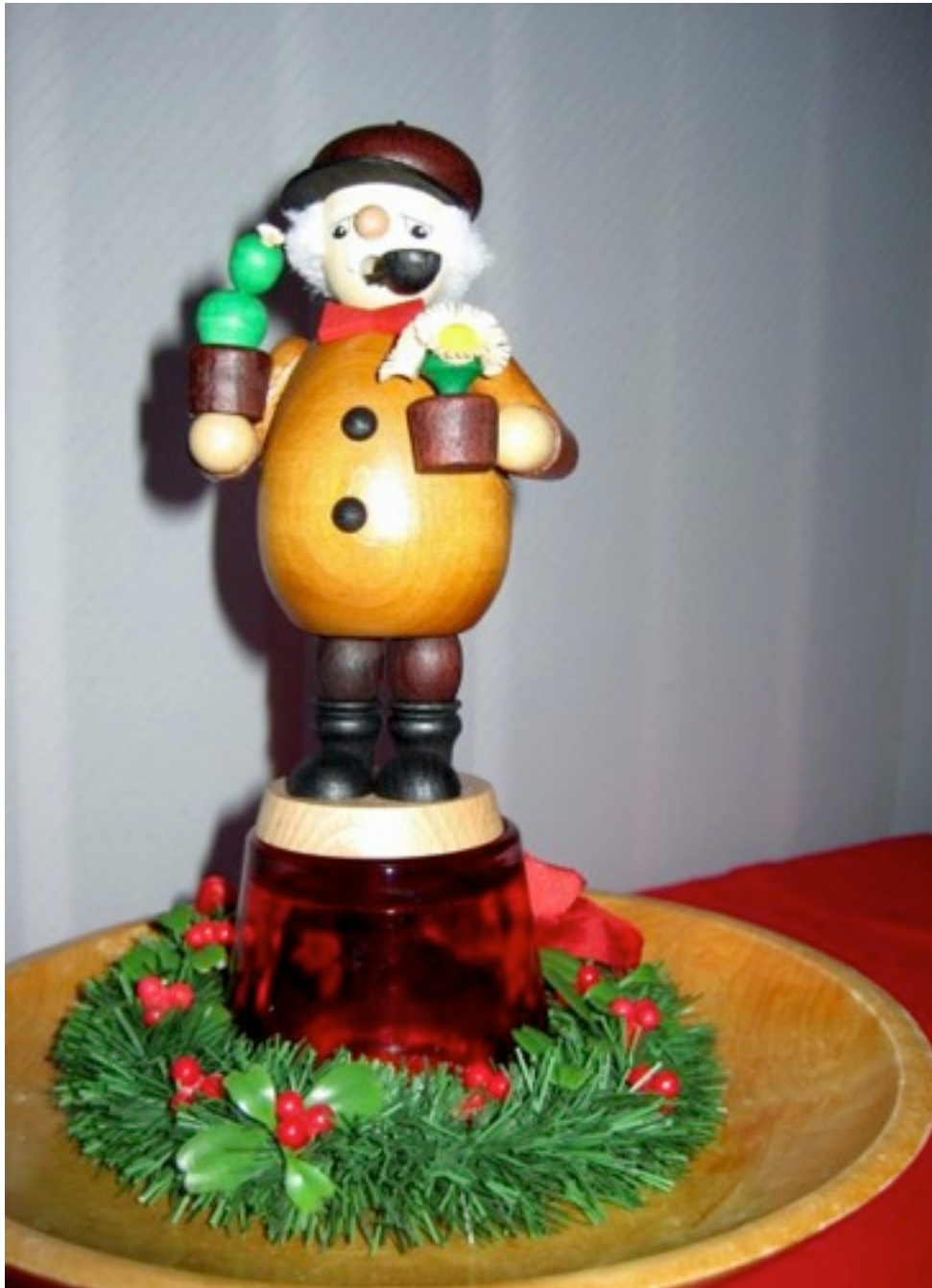
Der Räuchermann