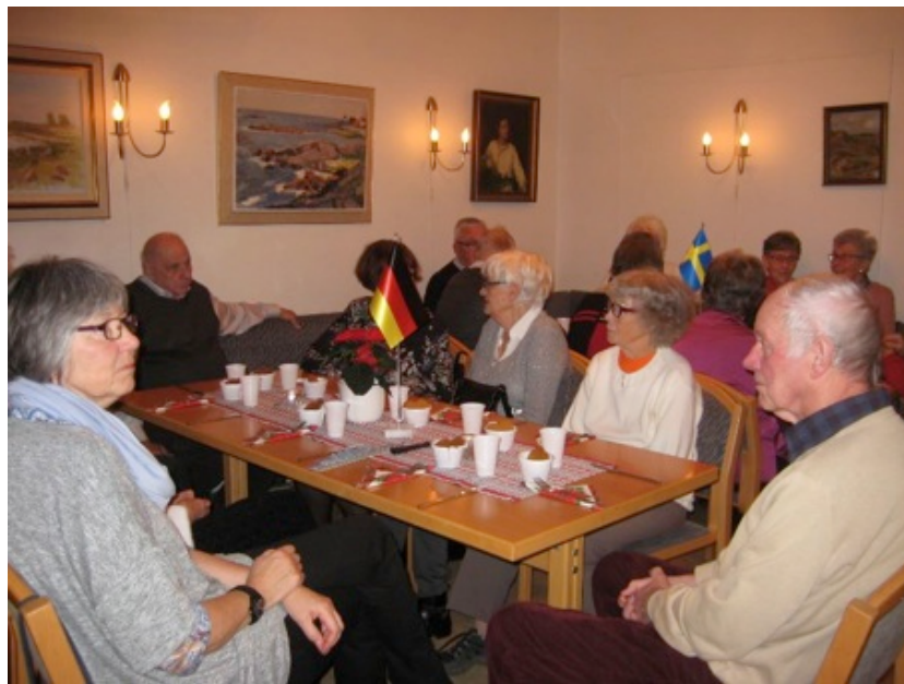
Här var det gemytlig stämning runt bordet!

Till sist vill jag tacka alla våra trogna medlemmar för ett fantastiskt 2017, och jag hoppas på ett lika bra 2018. Glöm inte att notera våra kommande möten, den 15 februari och 12 april, samt vår sommarresa den 8-11 juni till Husum med utflykter till traktens natursköna och intressanta omgivningar.