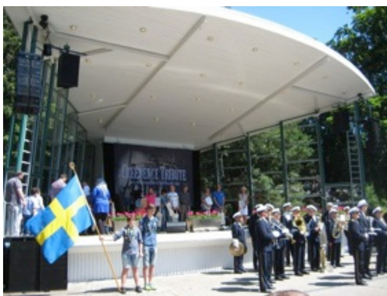
Nationaldagsfirande i stadsparken

Den 5-6 juni, då Trelleborgs kommun hade celebret besök från vänorterna Sassnitz och Stralsund, hjälpte några av oss i styrelsen till med att tolka till tyska. På programmet stod bland annat en bussrundtur i kommunen, besök på Trelleborgen, gemensamma måltider och det högtidliga firandet av Sveriges nationaldag.