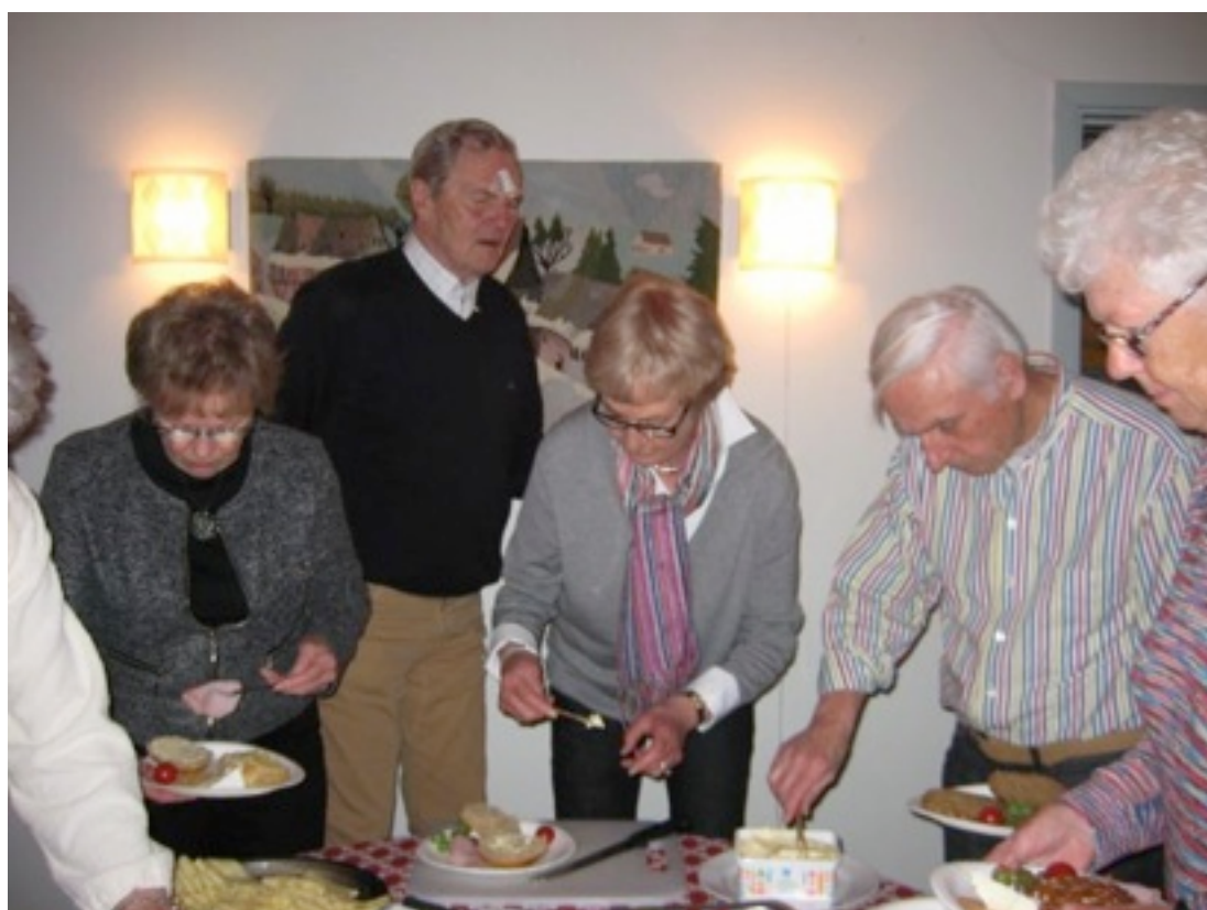
Trängsel kring buffébordet