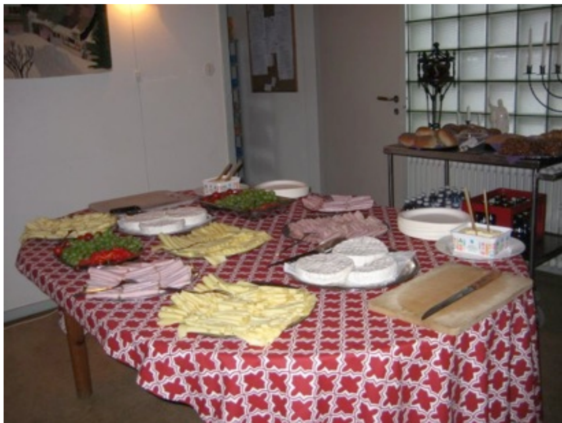
Guten Appetit! Smörgåsbuffén är framdukad