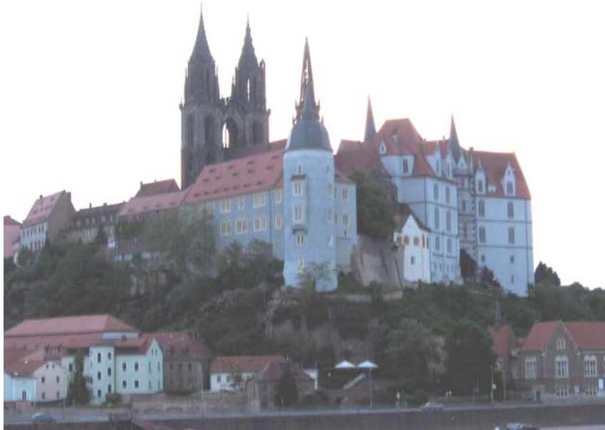
Slottet i Meissen

sina 23 regeringsår porslin för runt 1,7 miljoner taler, en enorm summa vid den tiden. Men det var inte alltid så noga med betalningen men kurfursten gjorde ju god PR för porslinet och alltfler ville ha ”det vita guld”. Mellan åren 1726 och 1746 hade fabriken serviser med 80 olika dekorer i fabrikation.