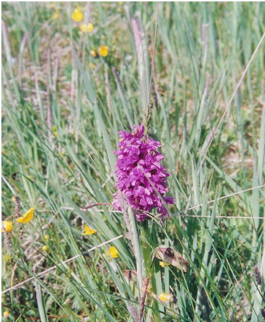
Ängsnyckeln tillsammans med Smörblommor, Kaveldun och Kabbelekor

På området spirar också den sällsynta Ängsnyckeln tillsammans med Smörblommor, Kaveldun och Kabbelekor alltmedan oroliga Vipor och Rödbenor vakande kretsar över sina ungar i gräsets bon.