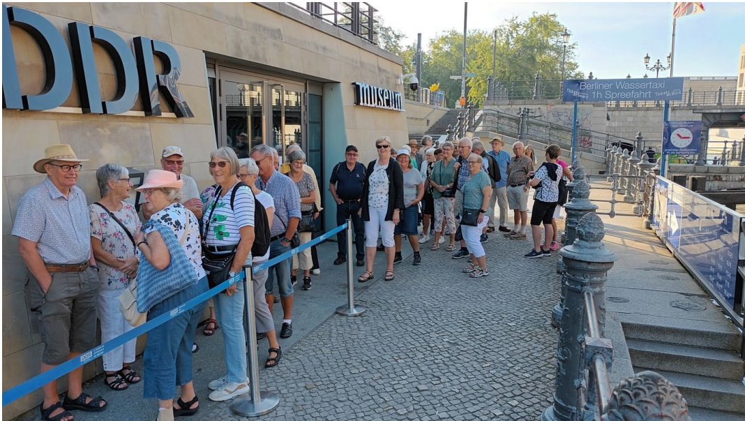
En alert grupp

”Plockemat” serverades och till detta god öl och dyrt vatten. Vatten som är dyrare än motsvarande mängd öl. Som tur var fick vi en sponsor av vattnet.