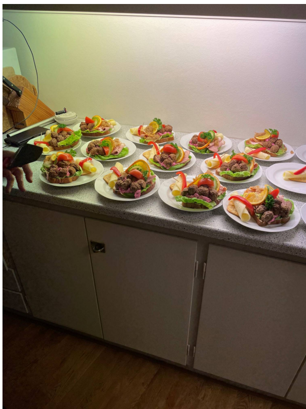
De juliga smörgåsarna väntar på att bli serverade