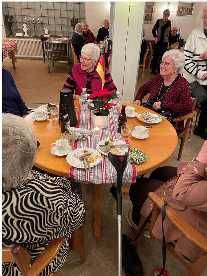
Visst smakade den mättande smörgåsen bra