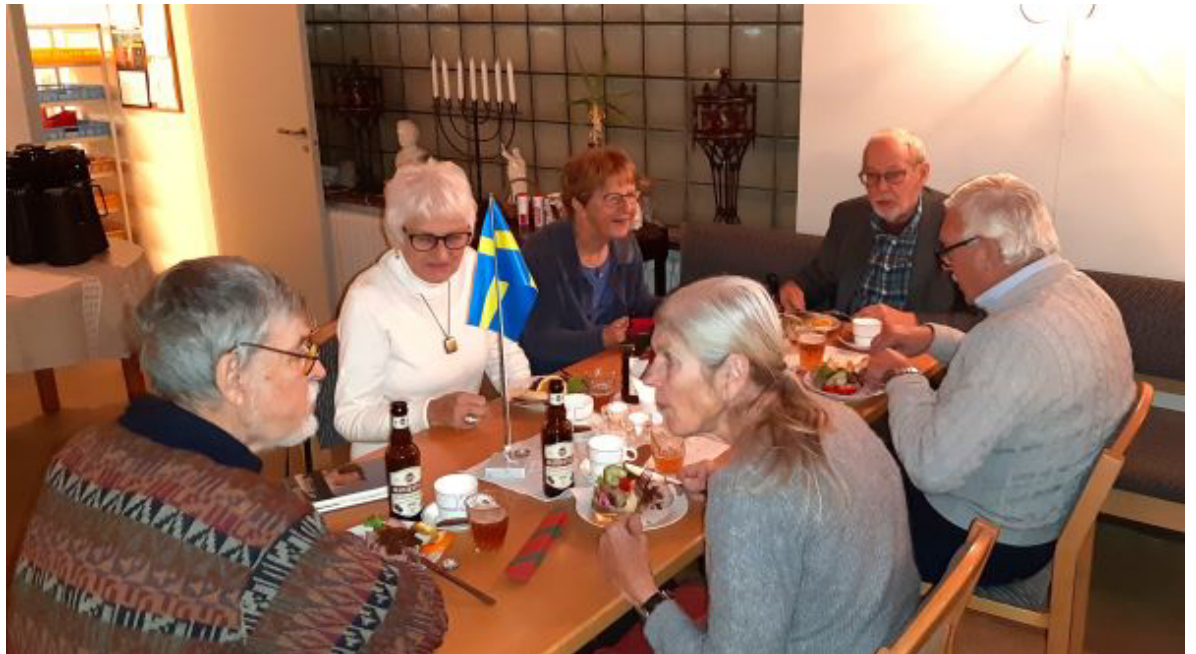
Det blev en glad kväll med god förtäring och trevlig gemenskap