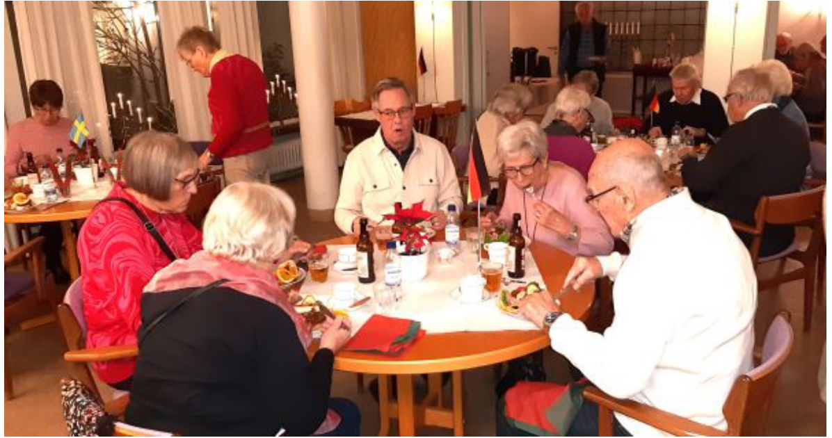
Mums, den här julinspirerade landgången smakade utmärkt