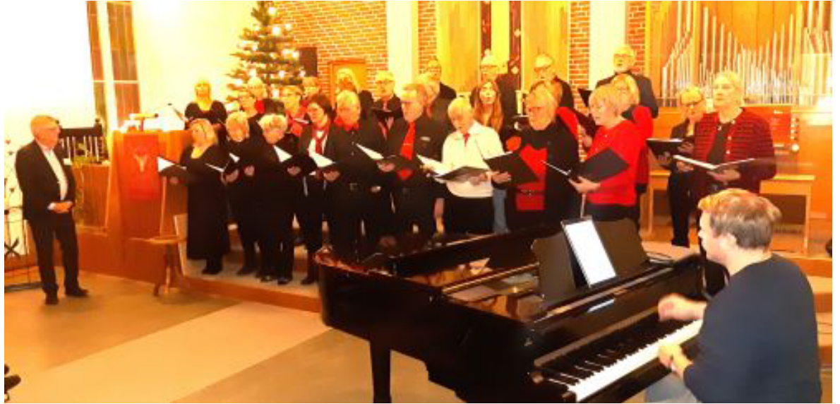
Kören Cum Pane fyllde kyrksalen med stämmingsfull sång