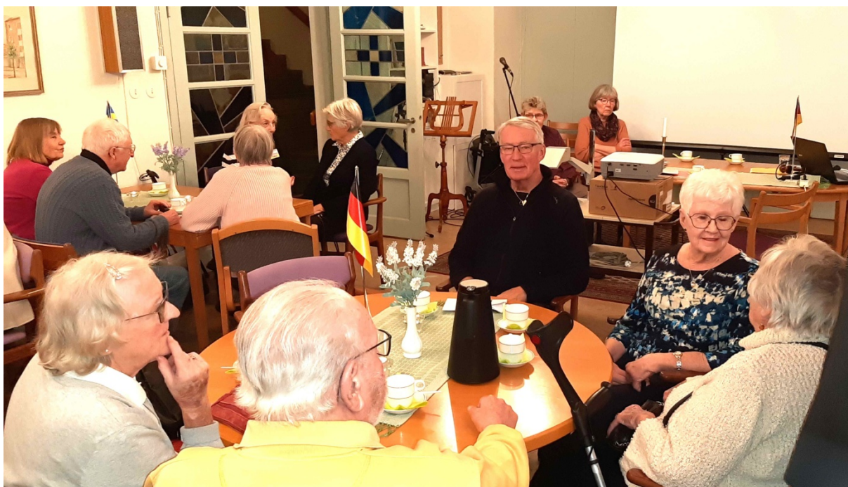
Glad och trevlig gemenskap