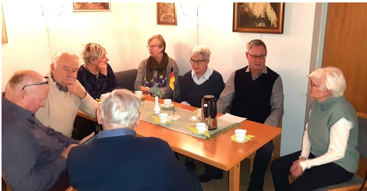
Ska smaka bra med kaffe