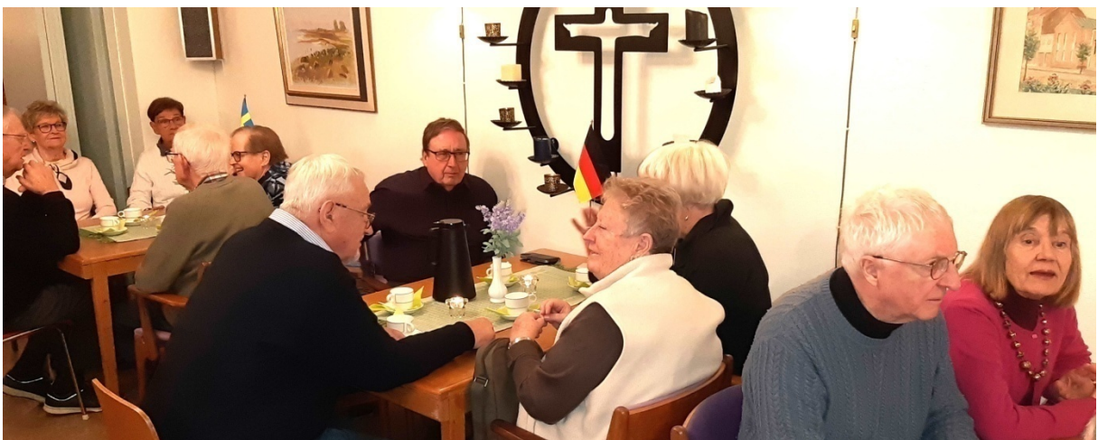
Samspråk i väntan på kaffe och fastlagsbulle