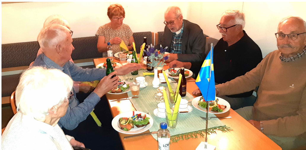
Nu ska det smaka bra med mat, tyckte det glada hörngänget