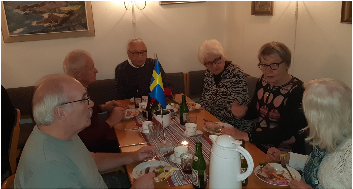
Det glada hörngänget (familjen Ahrén, Jönsson och Olsson)