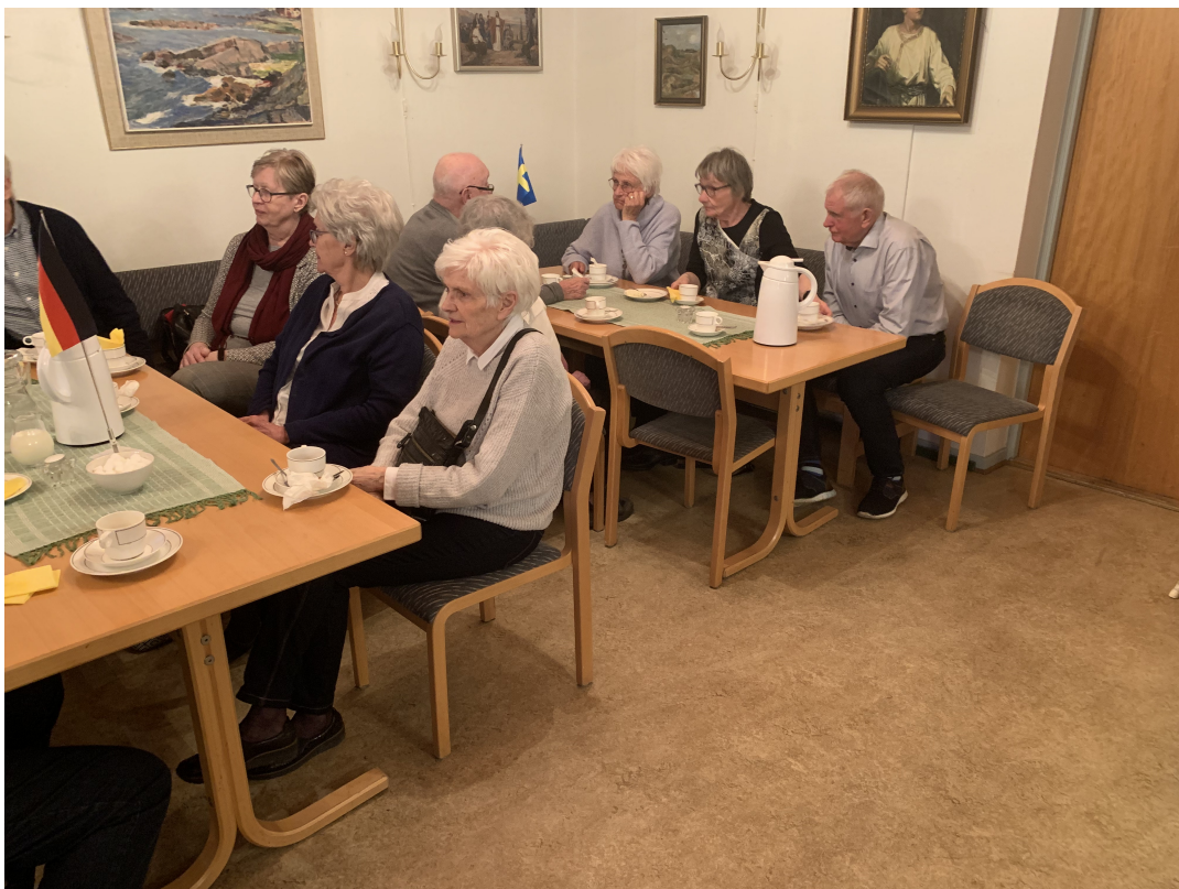
Kaffe och fastlagsbulle smakade bra efter årsmötesförhandlingarna.