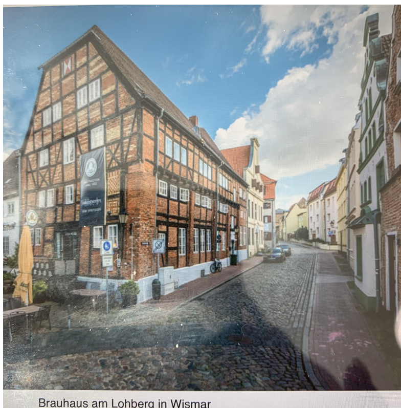
Brauhaus am Lohberg in Wismar

Vi kan alltså konstatera att Wismar ist ein Besuch wert!