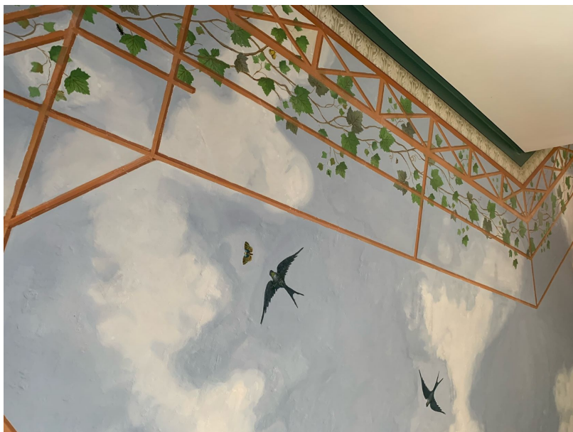
Takmålning på Fridhem