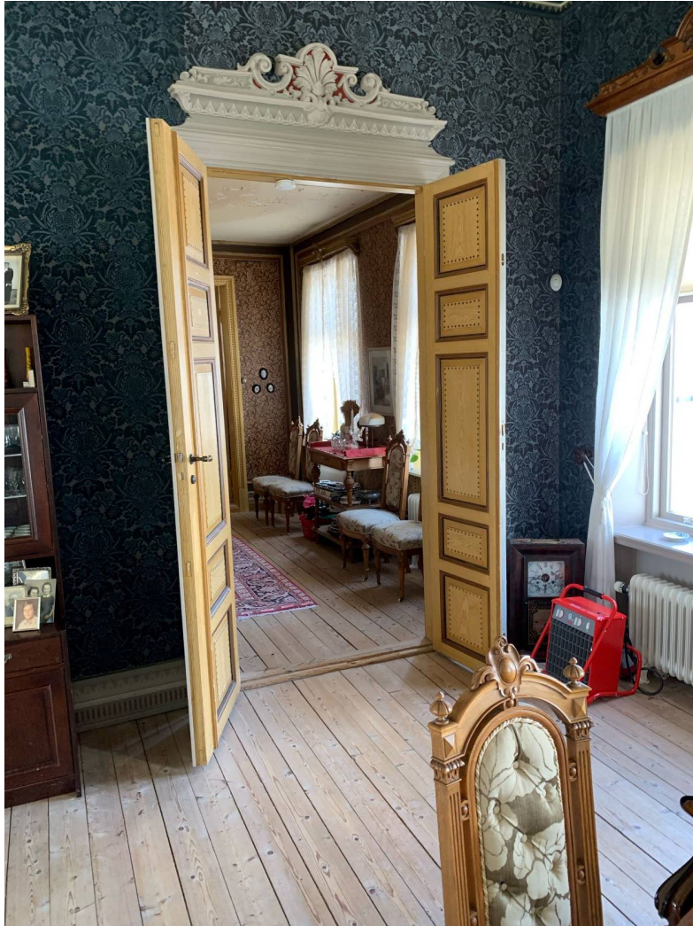
Välkommen in i stora salen!