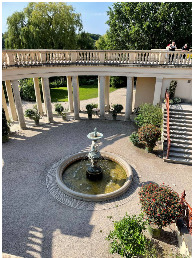
Slottet i Schwerin