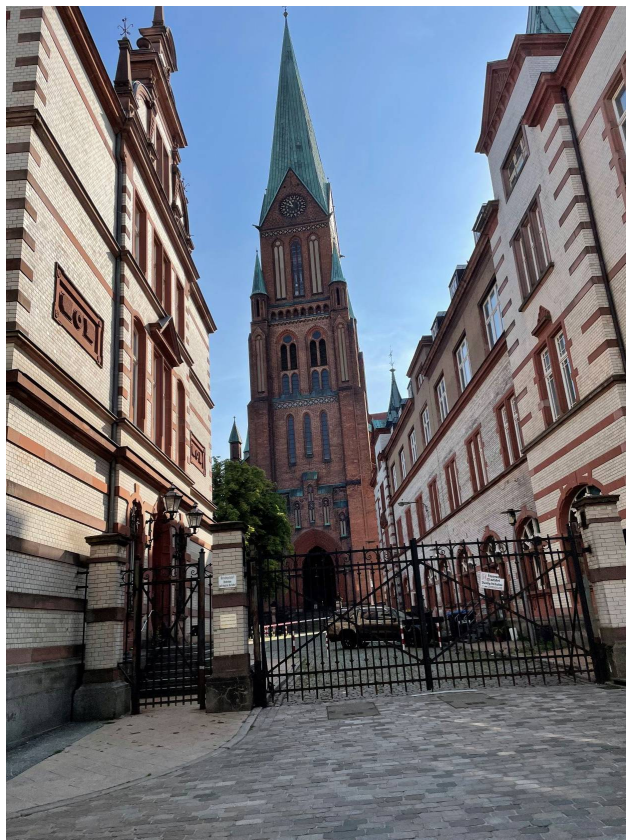
Kyrka i Wismar