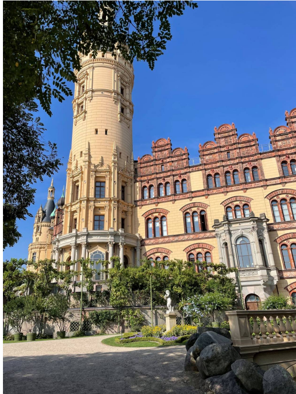
Slottet i Schwerin