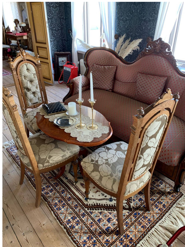
En av sittgrupperna. Se de eleganta stolarna