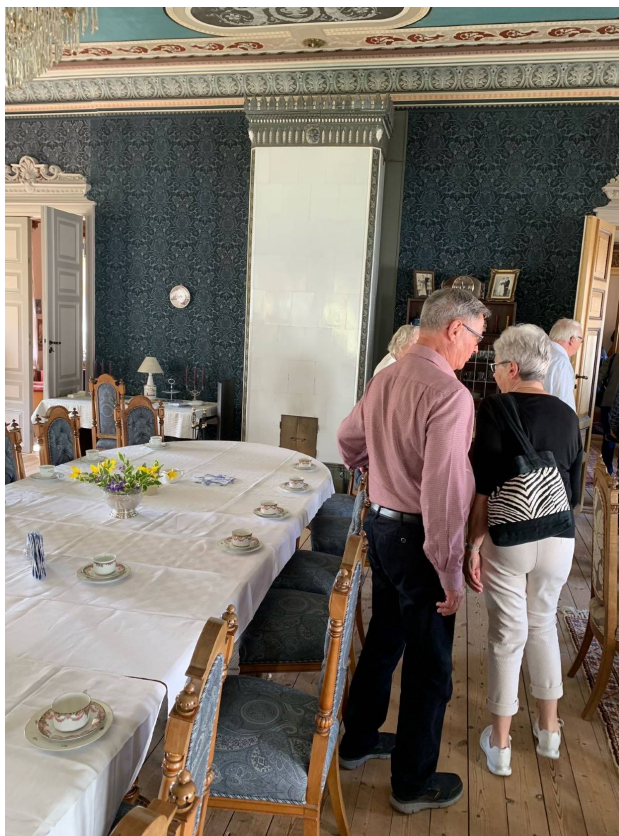
Bordet är dukat