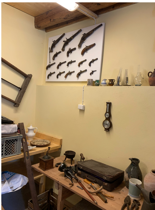
En del av museet