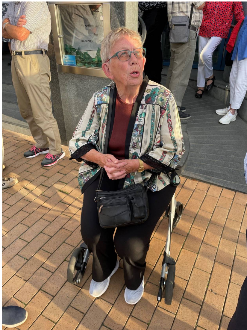
Resans reseledare och berättare

Det blev en trevlig och intensiv resa som var mycket välplanerad. Stämningen var god hela tiden. Förutom på nerresan med regn var vädergudarna nådiga och vi hade fint väder men mycket varmt.