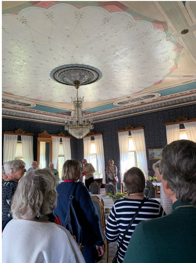
Takmålning ur en annan vinkel