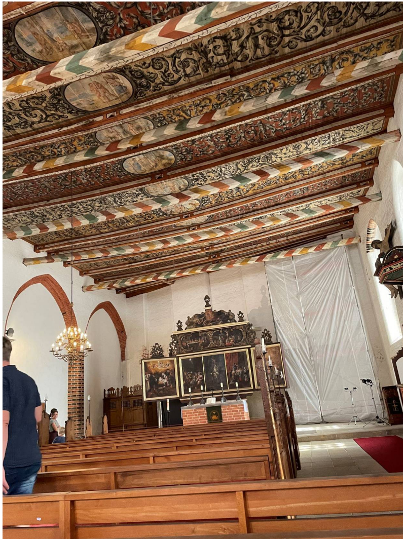
Själv besökte jag hamnen och gamla stan med besök i kyrkan zum Heiligen Geist med fina takmålningar på trä och en predikstol med alla apostlarnas namn.