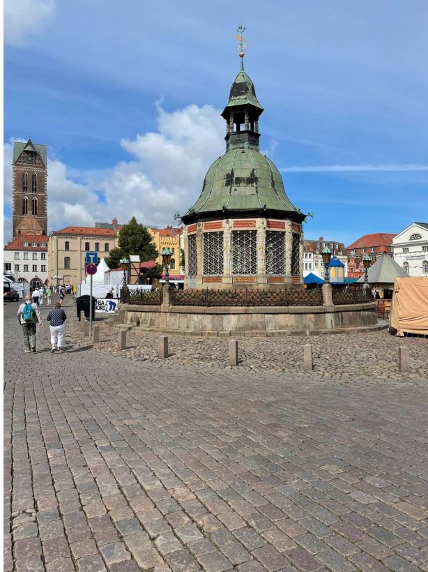
Torget i Wismar