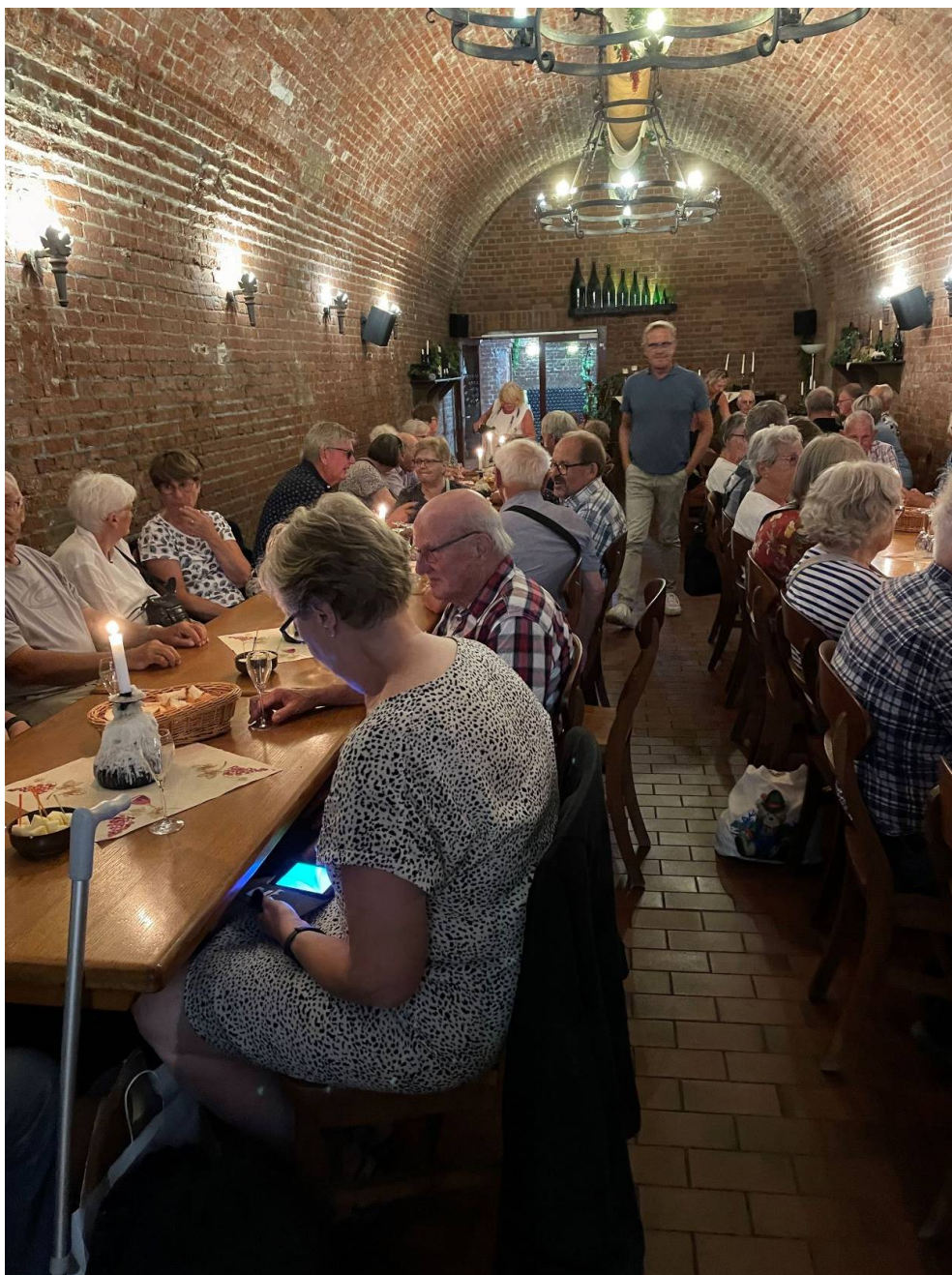
Sektkällaren i Wismar

Det blev både Fischbrötchen och kaffe och kaka, innan vi skulle samlas för sektprovning på Hanse Sektkellerei. Detta ägde rum im alten Gewölbe (10 meter under jorden), som var en del av en svensk försvarsanläggning på 1600-talet. Här var senare ett bryggeri inhyst och från 1920 använts som lager. Under kriget fungerade det som skyddsrum. 1991 grundades Hanse Sektkellerei och 1995 restaurerades lokalerna. Nu finns lokal för sektprovning och föreläsningar men huvudsakligen framställer man här sekt. Vi fick prova fyra olika sorter och man berättade hur sektproduktionen går till. Härefter samling för "hemresa" till Schwerin och lite vila innan intagande av en god middag på "Altstadt Brauhaus". Stämningen var mycket god och ljudnivån hög.