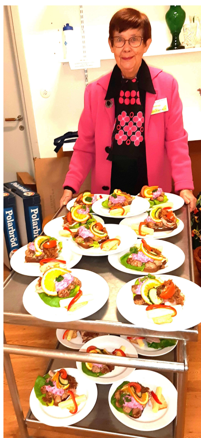
Sedan vankades det en "julig" macka, ost och kex med efterföljande kaffe med pepparkaka.