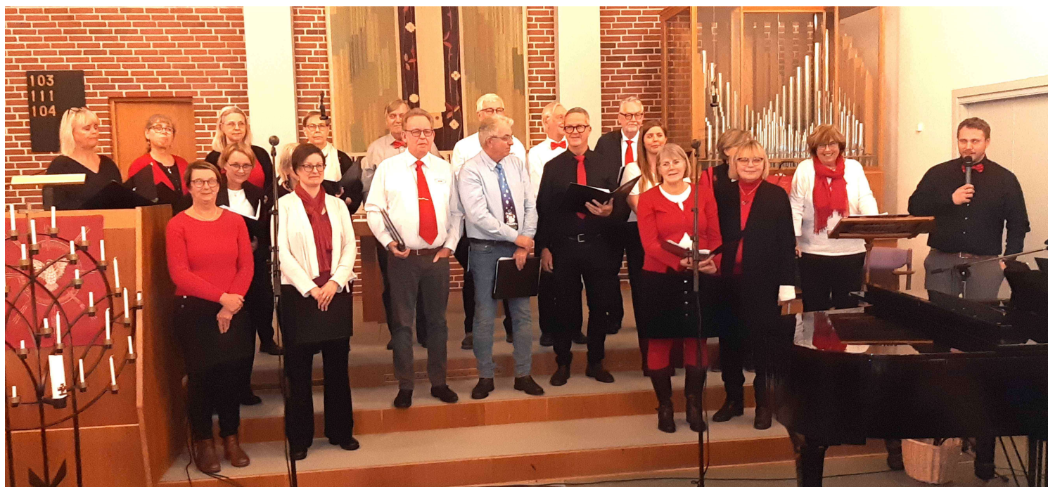
Cum Pane underhåller