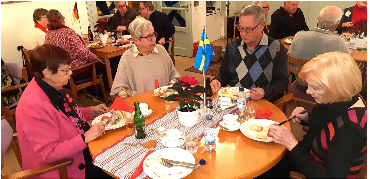
Som vanligt var stämningen god och det samtalandes livligt